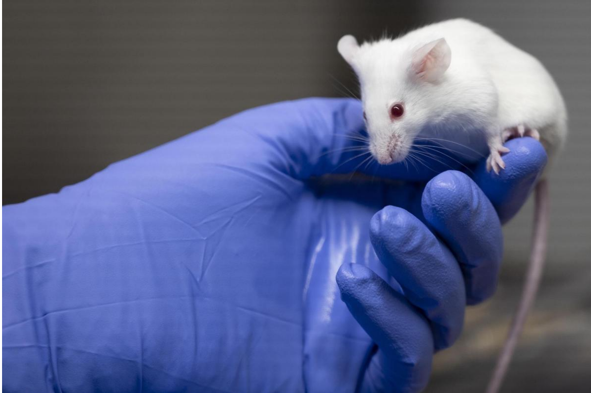
Mäuse sind die mit Abstand beliebtesten Versuchstiere. Im Jahr 2020 wurden schweizweit über 346'000 dieser Nager eingesetzt, drei Viertel davon in der Grundlagenforschung.

Die Verpflichtung, bei der Planung von Experimenten das 3R-Prinzip als oberste Richtschnur zu verwenden, hat unter anderem mitgeholfen, die Zahl der verwendeten Tiere von rund zwei Millionen im Jahr 1983 auf etwa 600'000 zu senken. 2020 wurden in der Schweiz 556'000 Versuchstiere eingesetzt, so wenige wie noch nie in den vergangenen 40 Jahren. Einzig Versuche mit der höchsten Belastung (Schweregrad 3) haben vorletztes Jahr – entgegen dem allgemeinen Trend – leicht zugenommen. In diese Kategorie fällt allerdings nur etwa jeder dreissigste Tierversuch.